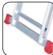
Detalle estabilizador Détail de stabilisation Detalhe estabilizador