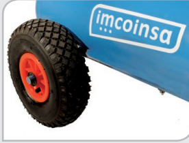
Ruedas Neumáticas Facilitando la rodadura.

Completa y eficaz solución de aire comprimido para su utilización en instalaciones donde no se disponga de suministro eléctrico (vehículos de reparación, sector agrícola, eventos, etc.).